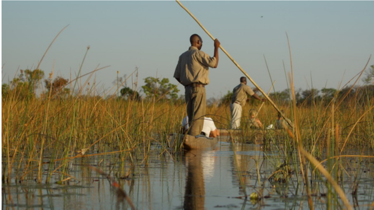
Eine Bootstour und eine Mokoro (Einbaum) Fahrt gehört im Okavango zum Programm.