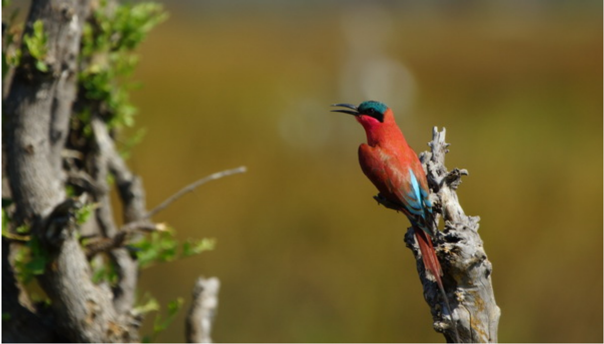
Begrüßungskonzert in der Dauerflutzone im Okavangodelta...