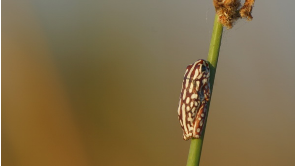
Ein seltener Frosch.