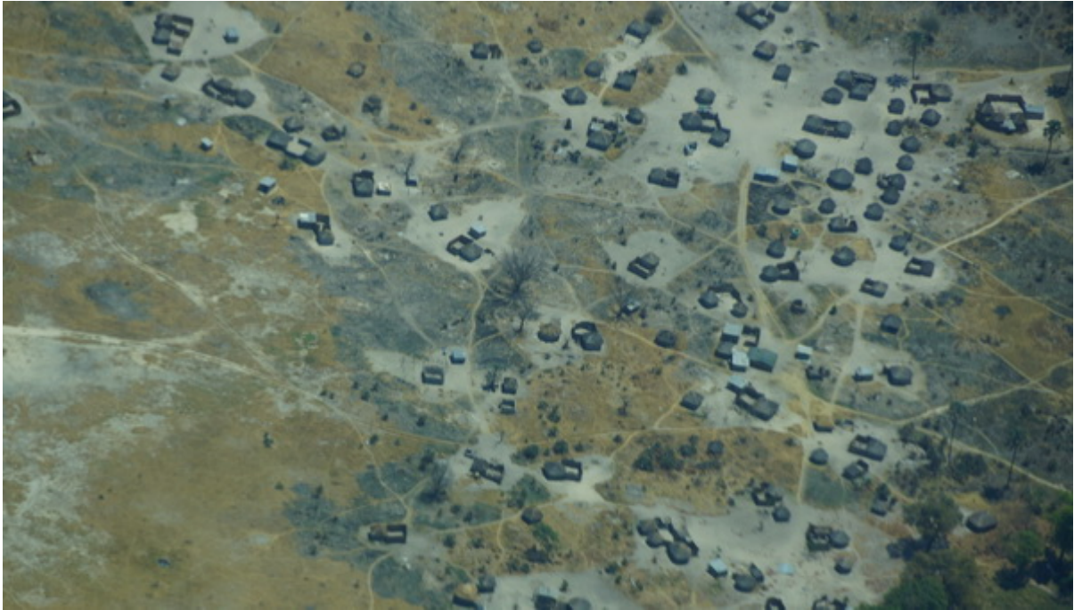
Dörfer im Delta