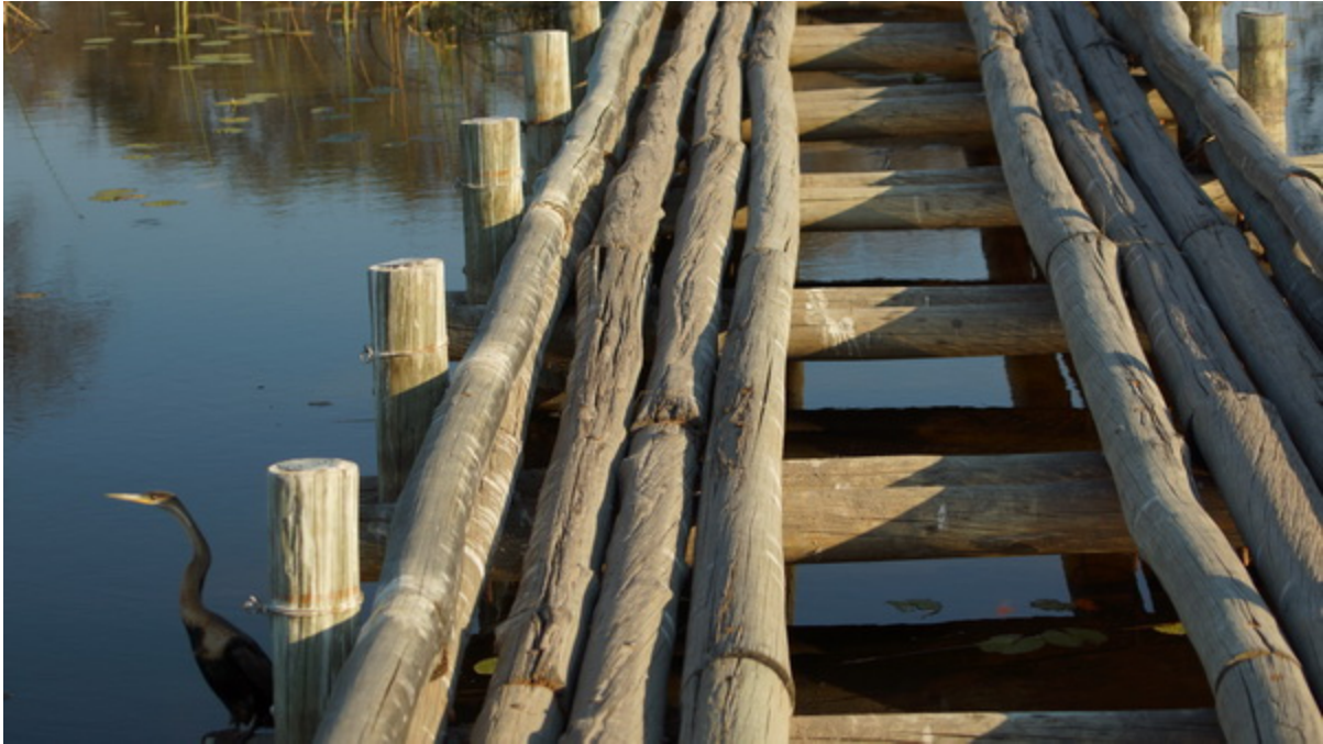
Wenn keine Brücken... dann halt durchs Wasser.....