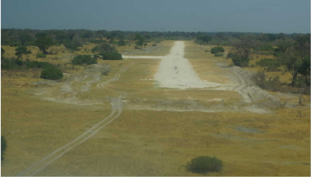
Landebahn (Airstrip) wird von Elefanten, Giraffen & Co. von den Rangern der Lodge freigehalten – weil diese über Funk nicht erreicht würden.....