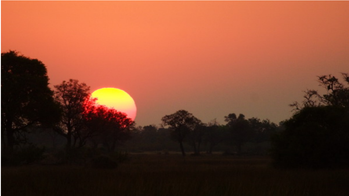
... die nachtaktiven Tiere sieht man bald nach Sonnenuntergang...